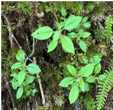
実生を見つけたら近くにだいたい親株があります。