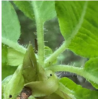
若枝や葉柄には長い開出毛がみられます。