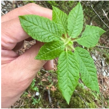
葉は枝先でまとまっています。

バイカツツジの花は小型で目立たず、慣れていないと発見が難しい植物です。以下の形態的特徴を参考に探索をお願いします。新産地の発見をお待ちしております。